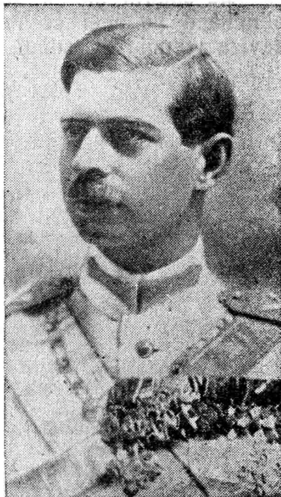
M. S. REGELE CAROL II

Inaintașii noștri, au muncit făcând jertfe pentru înfăptuirea idealului național, turnând tot ce au avut mai bun în sufletul lor, spre a pregăti pe făuritorii României Mari; noi aceștia de astăzi suntem obligați să facem jertfe pentru consolidarea ei și să făurim unitatea poporului nostru, dezvoltându-i virtuțile strămoșești «ca să facem din el una din gințile cele mai falnice ale lumii» .