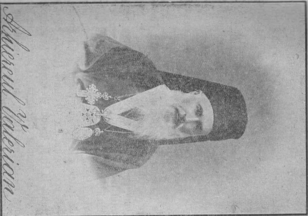
Arhiepiscopul Valerian Ștefănescu