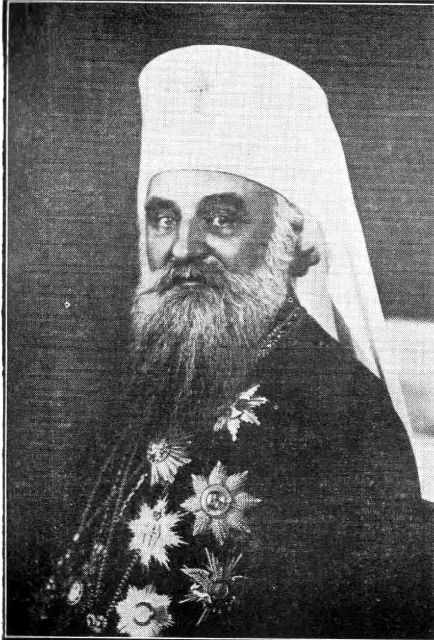
Patriarhul Miran Cristea (1868-1939)