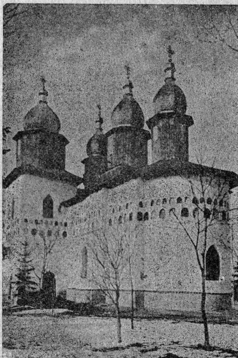
Biserica din Șerbești

Inscr. Trib. Neamț Nr. 10,272 | 1938, Cenzurat.