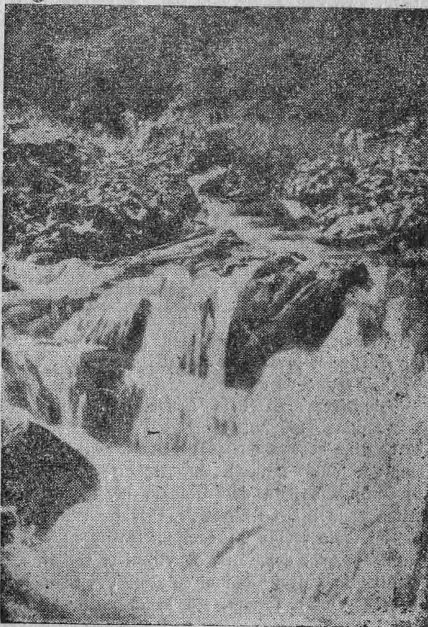
Cheile Borca — (Neamț)

Revistă literară, științifică și educativă Apare lunar sub auspiciile Asociației învățătorilor din Județul Neamț