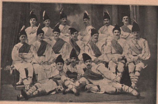
Teologii români din Arad cari au jucat „Călușerul și Bătuta” la balul aranjat de Reuniunea femeilor române din Arad.

pe care l'a păzit întreagă viața sa. Pentru puțină vreme se avântase de aici, ca să facă studii de drept în Aix. Dar nu eră în elementul său. De aceea a revenit și peste puțin scrisse în dialectul din Provanca, dulcea idilă „Mireio”. Pentru aceasta l'a distins Academia în 1861 cu marea premiu al poeziei. Peste puțin a fost onorat cu marea cruce a ordinului de onoare. De acî înainte îl apar la scurte restimpuri operele. În 1867 „Calendal”, poema, în 1875 colecția „Lis Jocolo d'or”, în 1884 „Nerto”, în 1890 „La Reine Jeanne”, tragedie, iar la 1890 scoate „Poème du Rhone”.