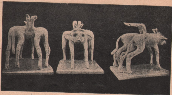
Un joc caprițoi al naturii: Un vițel cu două corpuri și un cap, și două din picioarele dinainte, crescute în sus, în spate, în loc de a fi la locul lor lângă celelalte.

societății Scoda capătă dividendă de 15%. De, așa-i lumea: mulți săraci, puțini bogați.