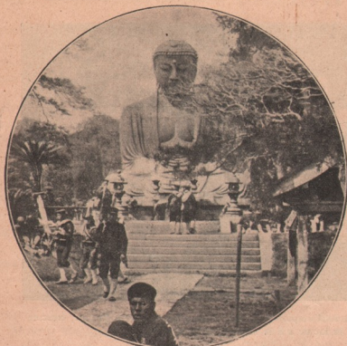
Cea mai voluminoasă statuie din lume e aceea a marelui Budha, din Kamakora, fosta capitală a Japoniei. — Statuia aceasta, numită de Japonezi Daibutsu, — executată acum 602 ani, adică în 1252. — are o înălțime de 17 metri, iar circumferința bustului de 34 metri. Lărgimea feței e de 3 metri, iar fiecare din cele 830 șuvițe de păr, are un diametru de 90 centimetri.

ca la vreme de grea cumpănă aceste 12 milioane de suptuși să se strângă sub același steag?