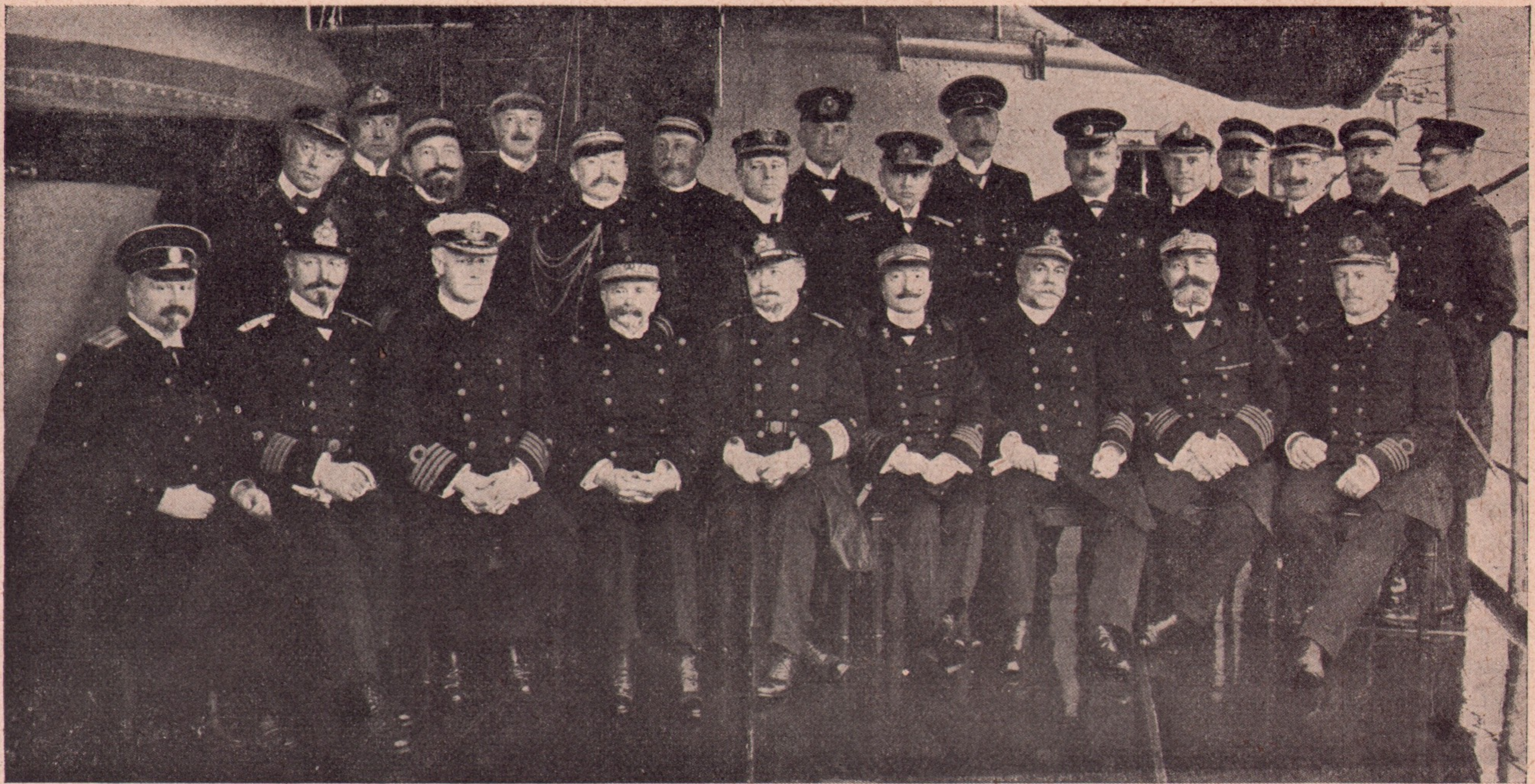
Comandanții flotei internaționale din naintea Constantinopolului. Cu privire la situația extrem de grea din Balcani, statele europene s-au decis, ca să ceară unanim Turciei terminarea războiului, cedând aliaților învingători Adrianopolul și insulele pe cari le pretind aceștia. La caz că Turcia va refuza să împlinească această cerere, flota internațională va face înaintea Constantinopolului o mare demonstrație.

Au venit, toți din ei, rând pe rând s-o vadă, afară de cel ce făgăduise 50 de franci pe lună. Da, cum veneau așa plecau. Nu stăteau mult, unu că are treabă, altu că-l așteaptă nevasta, altu că are niște afaceri. Și femeile au venit și toate au plâns cu văduva, amintirea lui nea Nicu, nu că le durea, ci unele, plângeau fără să știe de ce, altele că-și aminteau că și ele într'o zi pot să rămână văduve, și că și ele au să fie despuiate de aceleași bunuri, și fiecare o ispiteau cum trăește, și când le spuse că a dat drumul la slujnică, la bucătăreasă, că pensia ei se strânge la 30—40 de franci pe lună, că nu poate scoate banii împrumutați, că mănâncă acolo ce găsește, o ciorbă și mâncare, toate au strâmbat nasul.