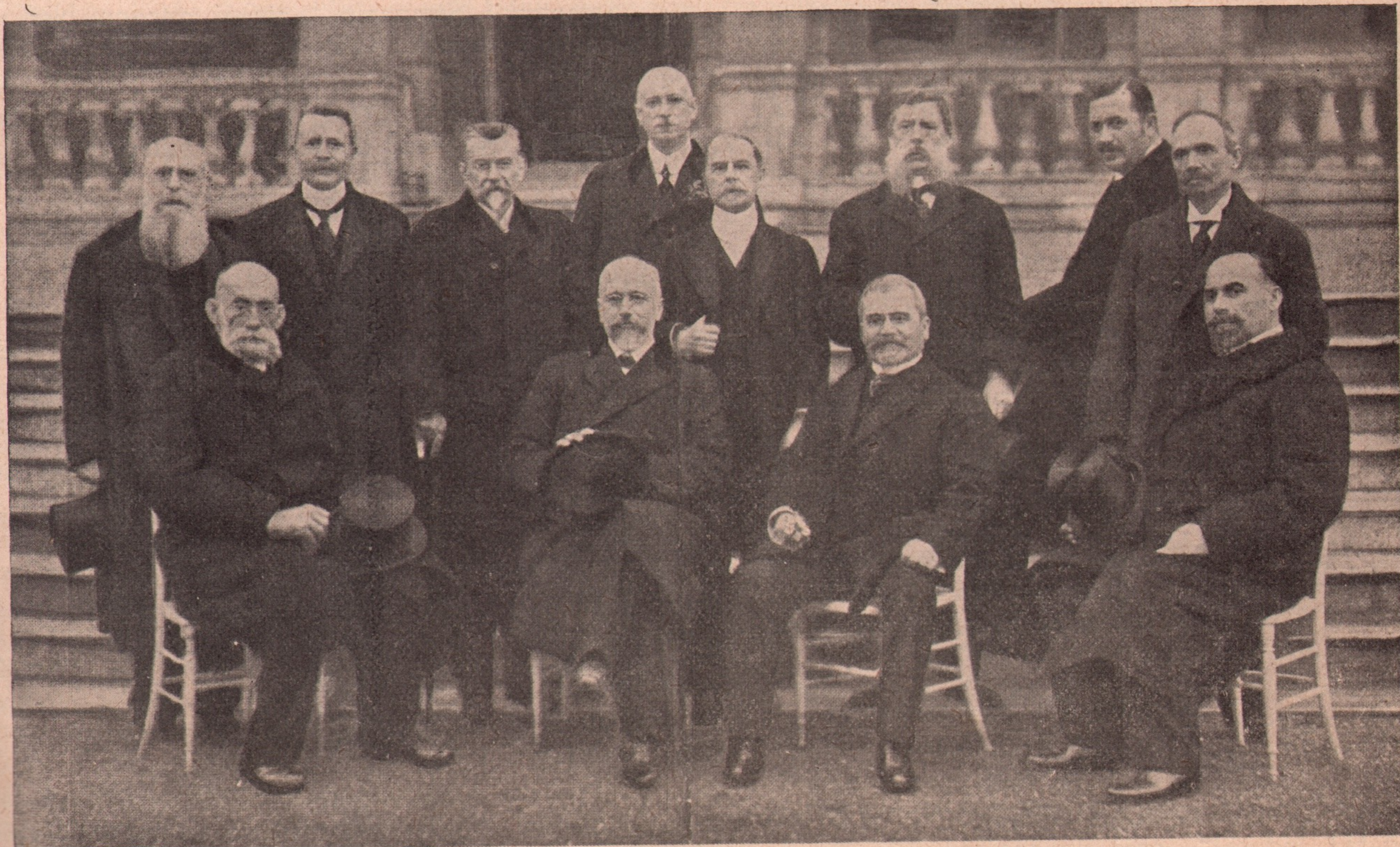
Trimișii statelor balcanice aliate în confărența de pace dela Londra, care s-a sfârșit fără să aducă pacea așteptată în războiul balcanic.

„Așa, glăsuî boerul, ia să-mi zici, Costache, cântecul cela vechiu al meu“.