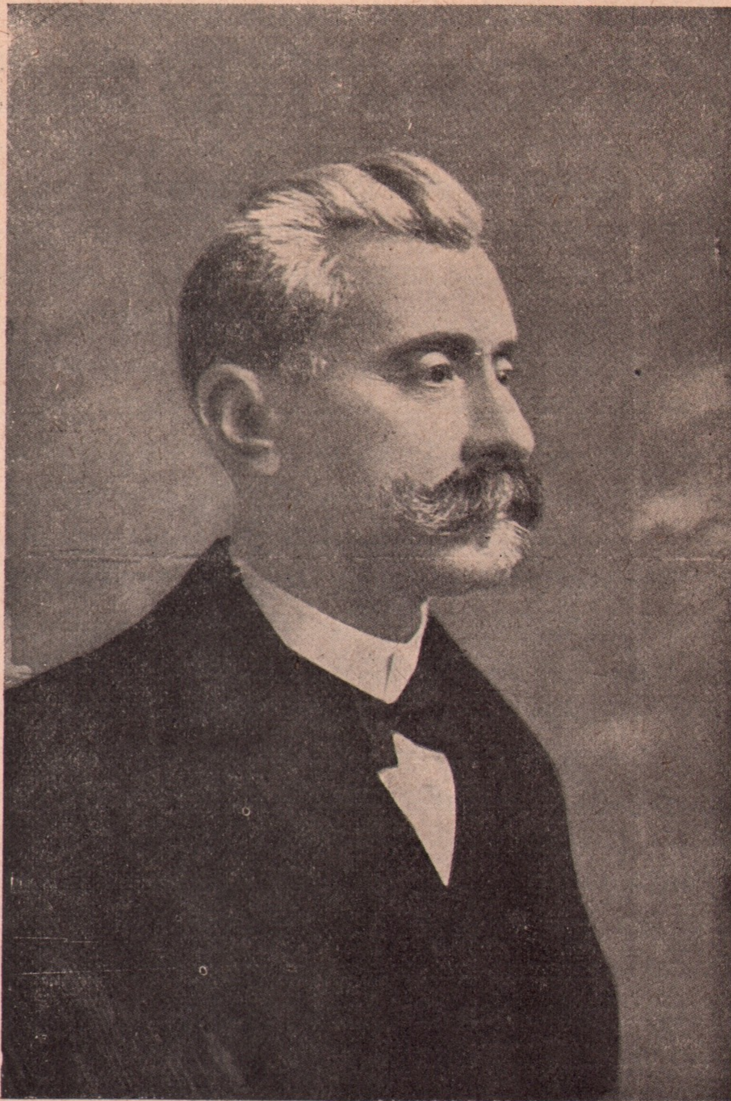
† Spiru Haret

— Ce mă privește pe mine personal, domnilor jurați, n-am avut pentru acuzat numai iubirea, ce trebuie să o simțescă un dascăl oricând față de un elev harnic, deștept, cu purtări bune. Pot spune, că l-am stimat ca pe un prieten mai tinăr. Când am început să predau în toamna trecută anatomia și am așezat în fața elevilor mei scheletul, cu ajutorul căruia să-mi însoțesc explicațiile cu demonstrații, am observat pe fața acuzatului o lumină neobicinuită. Era ca o înseminare, ce se produce pe neașteptate, când ni se împlinește o dorință veche, aproape uitată; sau ca o bucurie tainică, ce nu se poate tălmăci prin vorbe, când stăm deodată în fața unui chip drag, pe care