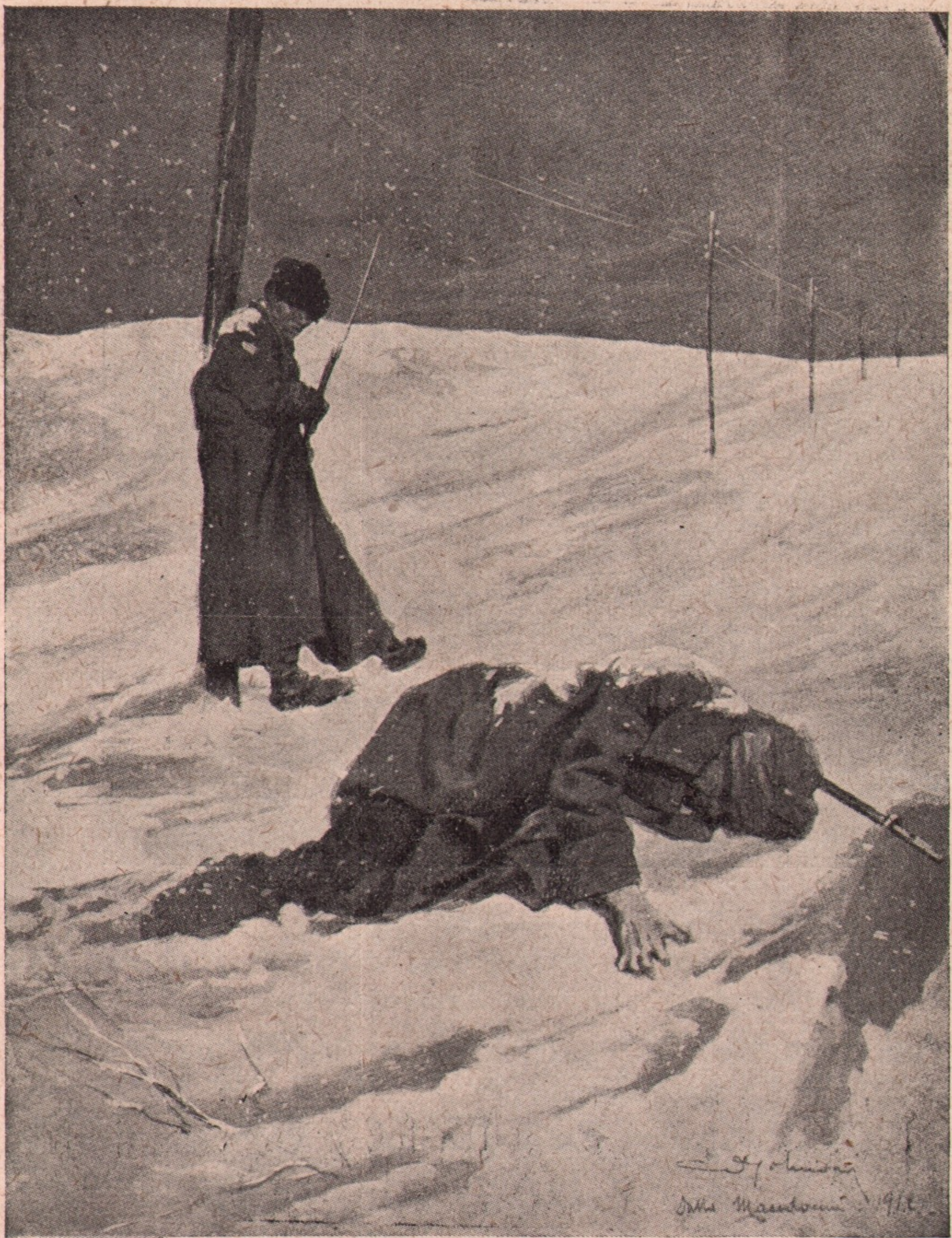
Sentinele, pe câmpul de luptă. Unul din cei doi soldați bulgari, cari au fost puși de pază, ca Turcii să nu strice sârmele de telegraf, a căzut de frig în zăpadă, dându-și sufletul.

sentimentul acesta de bănuială devenise la el tot așa de puternic ca și realitatea însași.