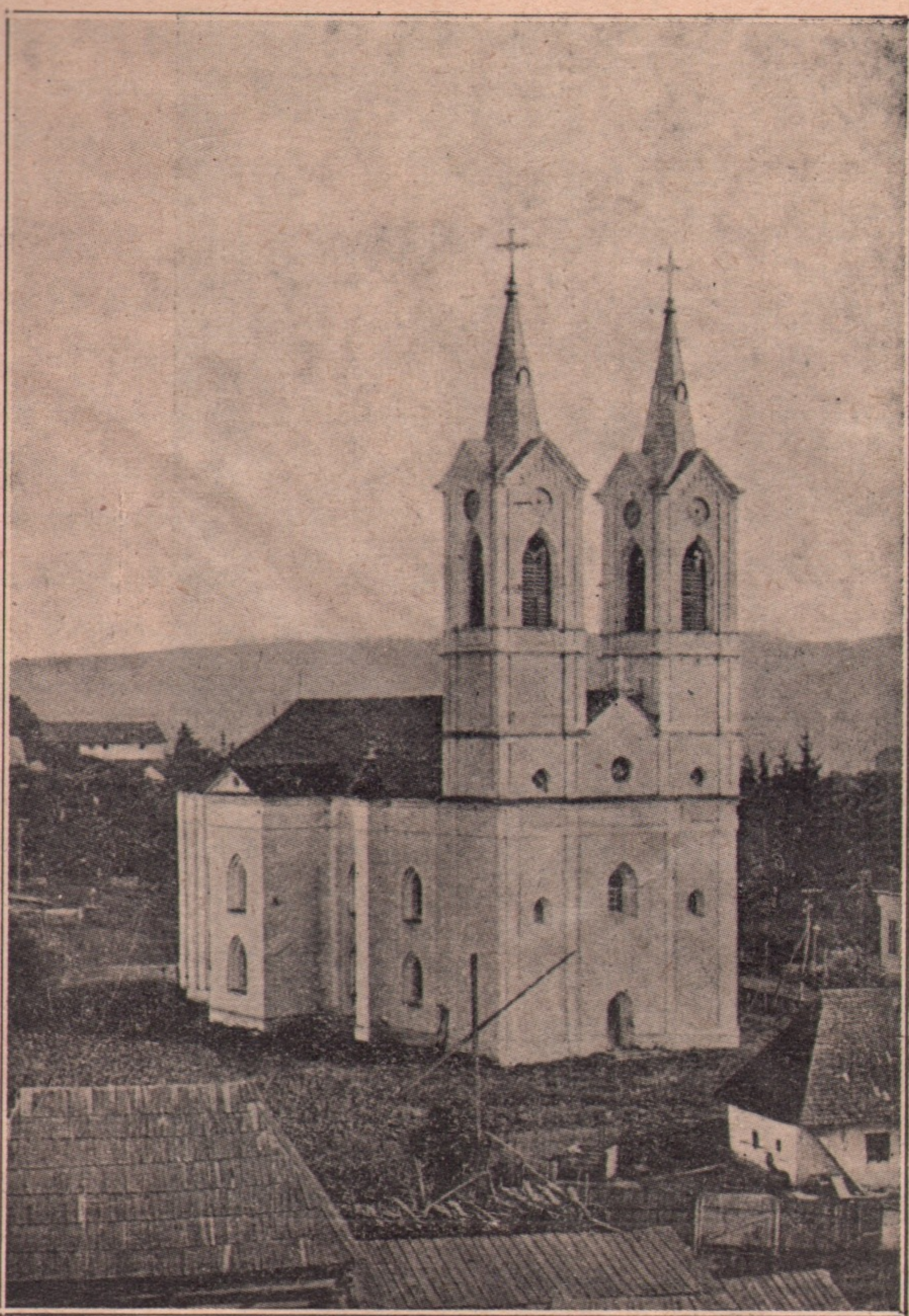
Vedere din Toplița: Biserica românească gr.-ort.

din margine se desprinde o pânză subțire de negură, ca aburii din gura unei ființi nevăzute. În sus, spre culme, lumina soarelui țese văl de aur peste creștele ascuțite ale brazilor. Și de tot sus, peste o muche de munte pleșuv, râde soarele tânăr, un răs potolit, cald, dumezeesc.