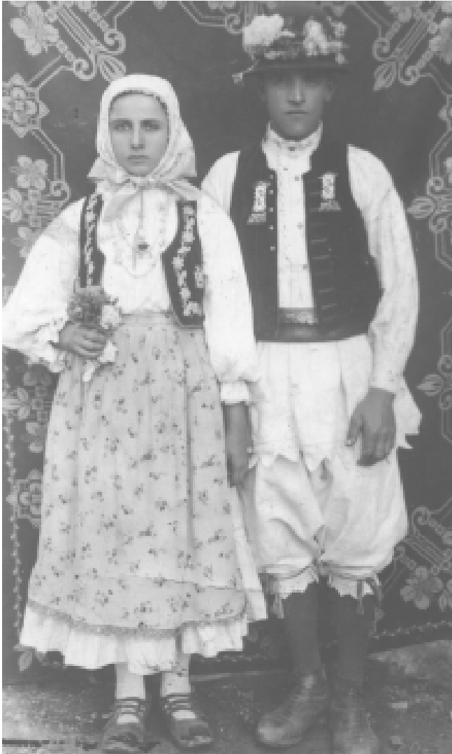
Portul popular în satul Visca