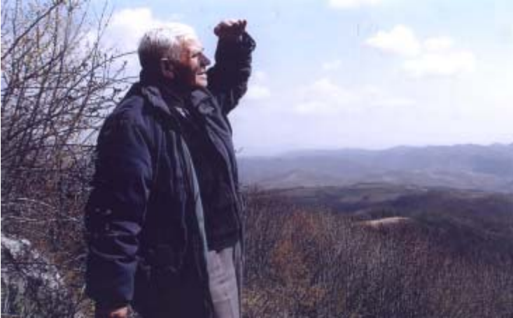
Autorul privind de pe Acoperișul Lumii