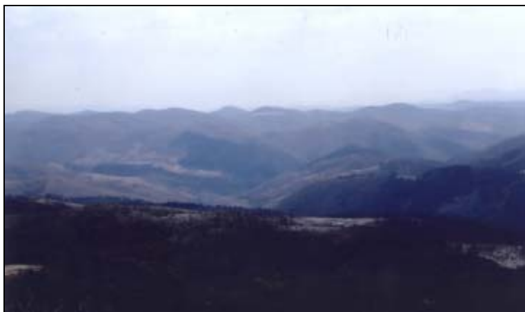
Fundurile de căldare din Poiana Mieza