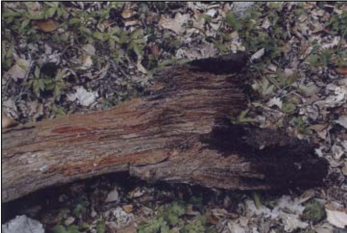
Mărturii din scaldătoarea din preajma conacului baronului de pe Dealul Gruii