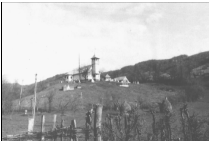
Biserica credincioșilor ortodocși din satul Visca