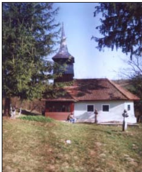
Biserica din Luncoșoara