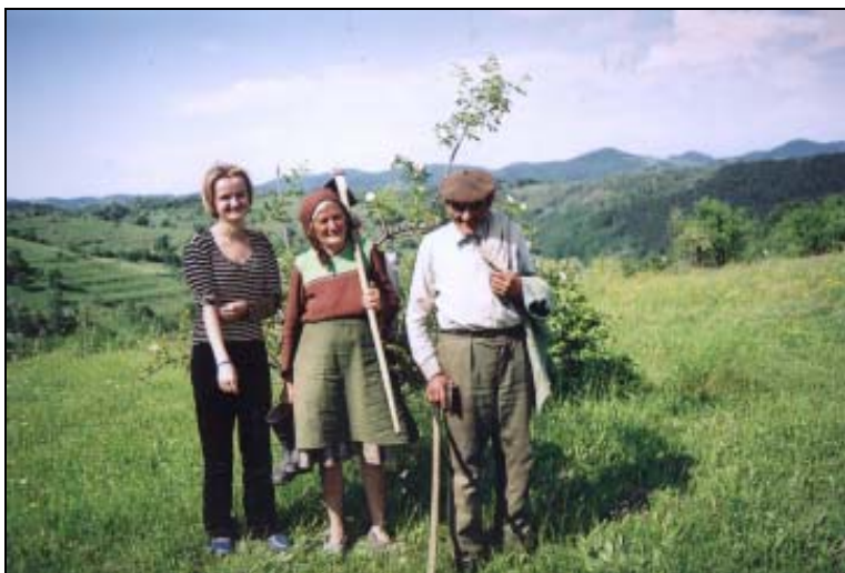
Dintre oamenii locului, care au fost și nu mai sunt