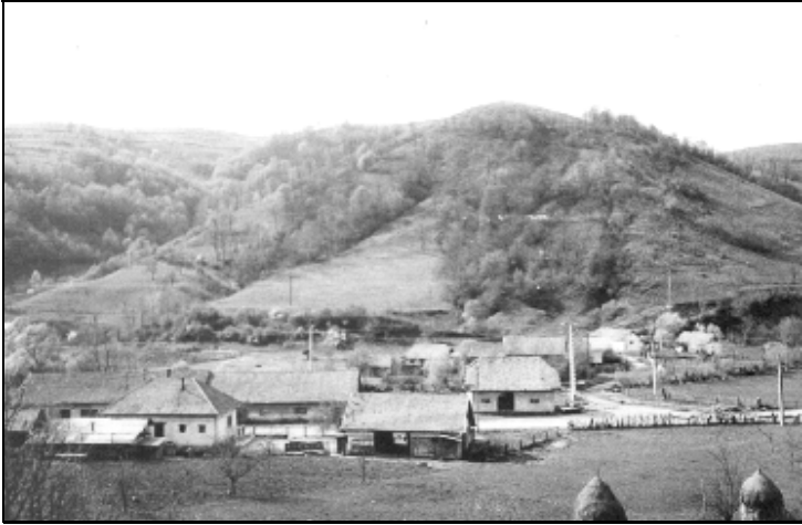
Un crâmpoi din satul Visca cu pitorescul ce vine din toate părțile