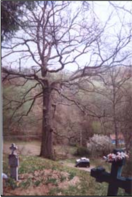
Stejarul din cimitirul Bisericii din Lunșoara