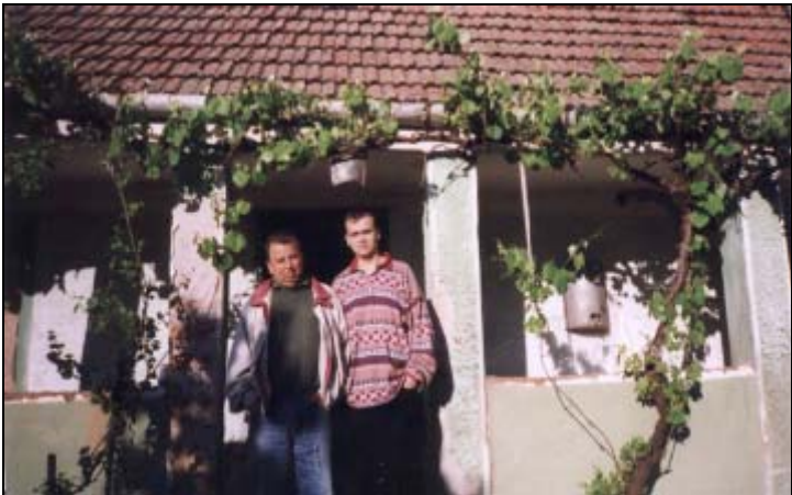
Tatăl și fiul într-o clipă de liniște