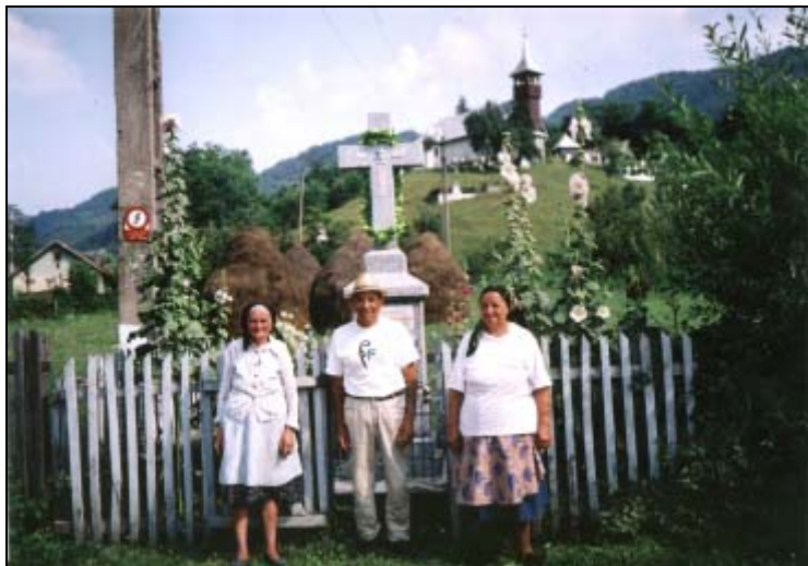
Clipe de liniște sufletească în fața Troiței și a Bisericii