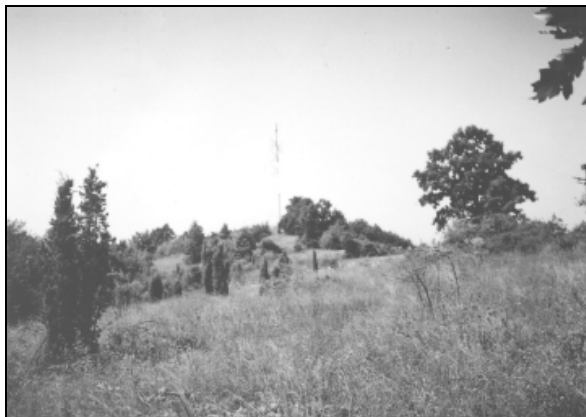
Vedere către releu