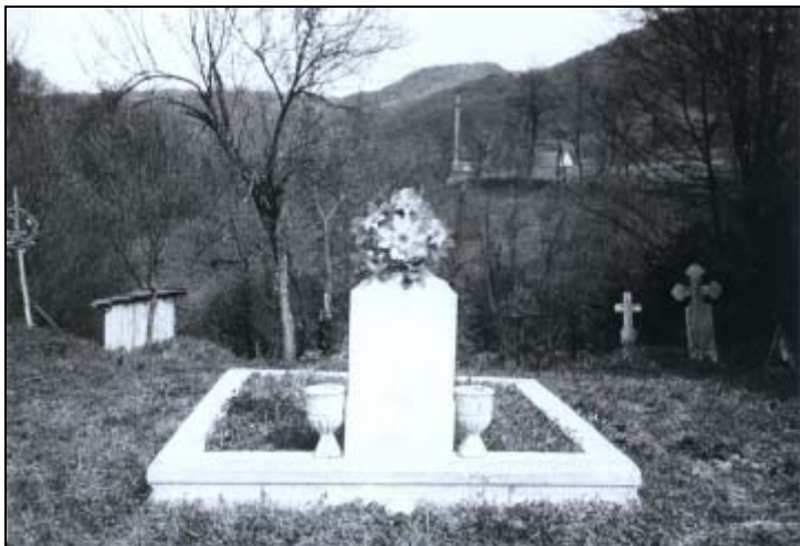
Semne ale celor ce au trăit odată în satul Visca