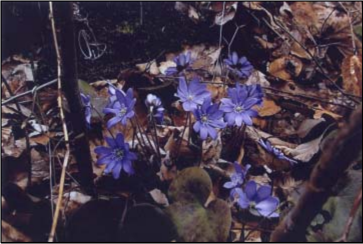
Florile - frumusețile primăverii