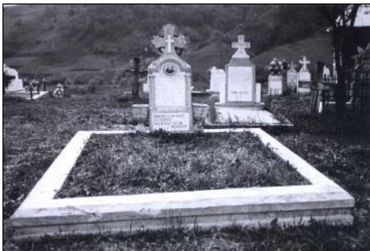
Cimitirul satului Visca locul unde sunt mormintele părinților lui Alba Simion