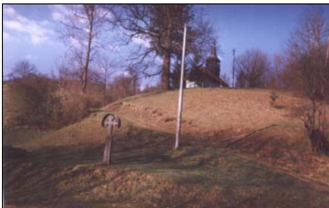
O troiță și biserica din satul Luncoșoara