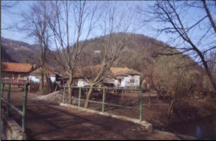
Intrarea în satul Valea Poienii