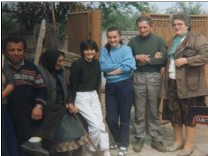
O întâlnire între neamuri