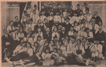
„Crai nou” în Caransebeș.

compusă din diamante și smaragde, care representă un trifoi în patru foi și eră primul cadou al soțului ei.