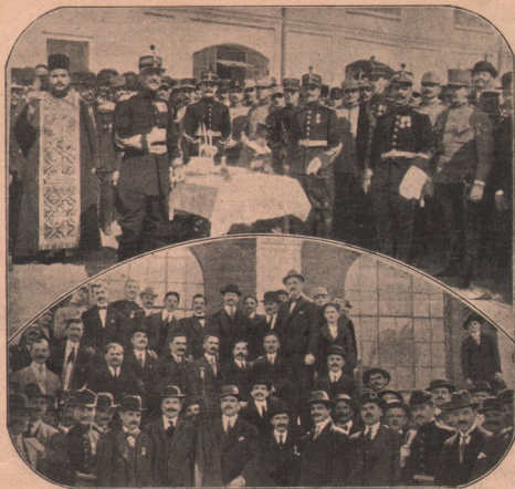
¶ Vedere din Balcic : O sărbare militară sub zidurile cetății: slujba dzeiască premerge părăzii. În chipul de jos al publicului, Români și Bulgari, auzind la paradă.