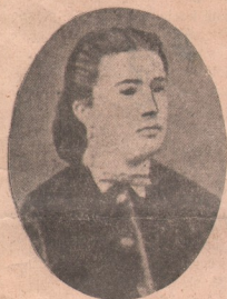
Henrietta, sora lui Eminescu.