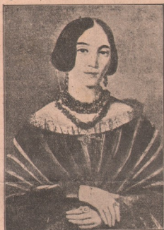
Mama lui Eminescu.