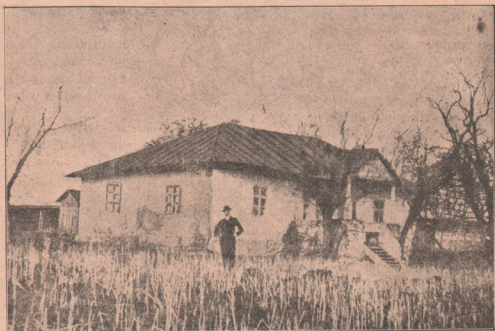
Casa din Ipotești, unde s'a născut Mihail Eminescu, la 15 Ianuarie, 1850.