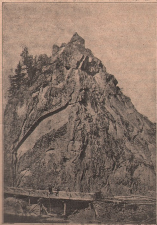
Piatra Corbului din Bicaz, în judeţul Neamţ, România.