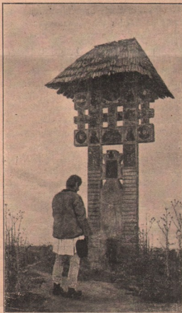
Un monument de artă țărănească: La cruce. Cinstitul și blândul Român și-a descoperit înaintea sfintei cruci capul și rămâne o clipă cu gândul dus la cele vecinice. Icoana Mântuitorului și a celorlalți sfinți de pe cruce, o crede atotputernică și-i cere ajutorul pe drumul, pe care a pornit.

Aceste două ilustrații le dăm după albumul de fotografii a domnului I. Voinescu, care a adunat o mulțime de monumente de artă populară, contribuind în nespus de mare măsură la conservarea acestor însemnate lucruri, cari oglindesc așa de viu talentul și hărnicia țărânului român. Meritul domnului Voinescu e îndeosebi mare, fiindcă dănsul, — când alți cărturari se interesează așa de puțin de viața artistică a poporului, — nu pregetă a cutreera satele în larg și 'n lat, și a prinde în mașina sa de fotografiat tot ce-i interesant, frumos și tipic popular, numai ca să treacă pe placa conservatoare aceste frumseți naționale și ca să ne deschidă și nouă ochii și să ne facă să vedem dibăcia fraților dela țară, ca apoi, în consecință, să-i știe prețuri mai mult și să ne fim mai dor a face de prin cele orașe câte o excursie la ei, cu scopul, de-ai povățui, a-i îndemna la lucruri din ce în ce