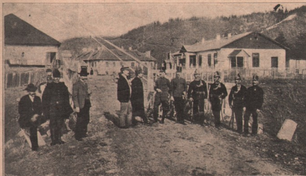
Vedere din Tulgheș: Granița româno-ungurească.