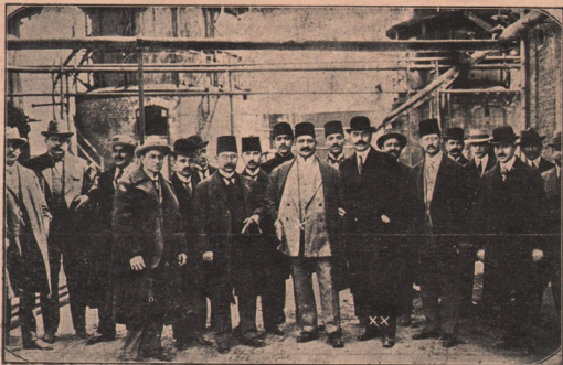
Talaat Bey (x) și dr. C Angelescu (xx) ministrul lucrărilor publice, fotografiați cu însoțitorii lor, cu ocazia excursiunii făcute la Câmpina.

Eră natural, că Romanii, cari stăpâneau un imperiu atât de vast, să călătorească foarte mult, fie ca oșteni, fie ca agenți administrativi, sau ca ocărmitori. Drumurile bune pe cari le aveau dovedesc cumcă erau călători pasionați și înflegători. Căci nu călătoreau numai oșteanul sau negustorul, ci patricianul roman, trândăvit și rupt de plăceri și de ospețe, ieșea la țară, să se învioneze la sânul naturii. Vilegiatura nu este o invenție a vremurilor moderne. Ori unde se aflau în Italia locuri romantice, munți umbroși și văi cu climă dulce, se întâlneau sumptuoasele vile ale se-