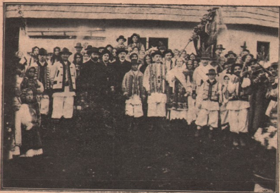
O nuntă țărănească din Zorani, lângă Margine, în Bănat.

iau parte și factori mai potoliți, se hotărăște pentru concert.