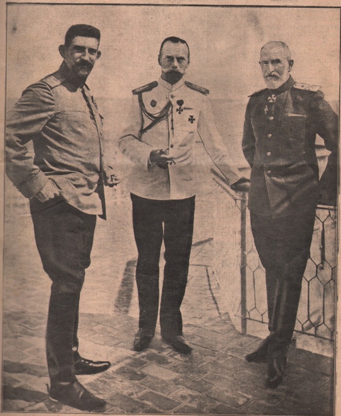
Capii destinelor din Balcani: țarul Nicolae II., regele Carol al României și moștenitorul de tron Ferdinand.