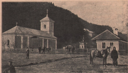
Vedere din Tulgheș: Biserica gr.-cat. română.

— O, Doamne, tinerii de astăzi cum sânt! Amână atâtea petrecerea din vara asta, par'că n'ar mai avea de gând s'o țină. Anul trecut pe vremea asta sosiseră deja invitările. Desigur. Dar acum de ce nu mai vin?