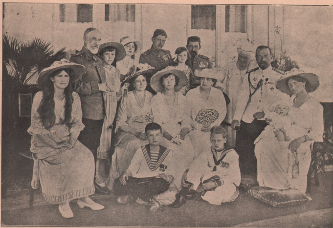
Intrevederea dela Constanța: Familia imperială rusească, fotografată la un loc cu cea regală română, al cărei oaspe era. Iaca cine sînt (ceit dela stînga la dreapta): Sîrul ce merge sus: La stînga e una din fiicele Ţarului, Marea Ducesă Anastasia, lângă ea, în şirul de sus, M. S. Regele Carol; altă fiică a Ţarului: Marea Ducesă Maria, lângă ea Prinţesa română Mărioara, urmează Principele Carol, apoi Prinţesa Ileana, Principele Ferdinand, Regina Elisabeta, M. S. Ţarul, apoi Marea Ducesă Olga, care ţine în braţe pe micul Prinţ român Mircea. — La mijloc în chip se văd: Ţarevna Rusiei, Marea Ducesă Tatiana şi Prinţesa Maria. — Jos: Ţareviciul Alexis cu Prinţşorul Nicolae, care s'au jucat mult şi s'au luptat şi s'au stricat jucării...