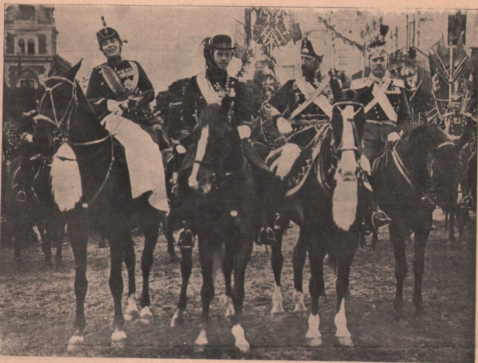
Vedere dela serbarea de 10 Mai în București: O scenă din marea defilare a armatei pe dinaintea Regelui Carol; La stânga e Prințesa Maria, în uniformă de Colonel de Roșiori, călărind în fruntea Regimentului său; la dreapta Prințul Carol în uniformă sa de locotenent de Vânători, mai la dreapta Principele Ferdinand ca general de Roșiori, iar la dreapta de tot Prințul German Waldek Pirmont, ce se află în București.

mănuile mai libere. Directorul și conducerea școlii, au toată încrederea, de care nu abuzează niciodată. E ușor să ne închipuim aceasta, gândindu-ne cât de mult se ține la cinste în Apus.