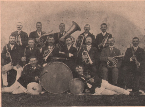
Fanfara „Reuniunii române de cântări” din Mercurea.