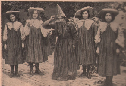
Altă scenă din „Crăiasa Codrului” jucată la Beiuș.

Iată un titlu care ar face pe ori-cine să zimbească; iată un titlu care ar putea să fie luat de ori-cine