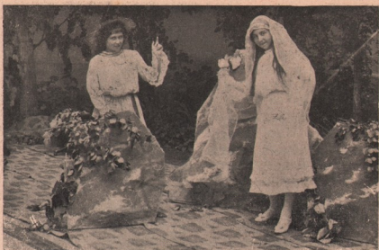
Tot scenă din „Crăiasa Codrului”, cu care drăguțele diletante au avut foarte frumos succes.

Centrul studențesc a făcut apel la toți artiștii din țară și din străinătate.