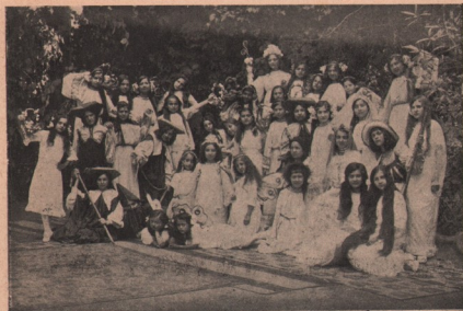
Scene din „Crăiasa Codrului”, piesă jucată de fetele Internatului „Pavelian” din Beiuș.