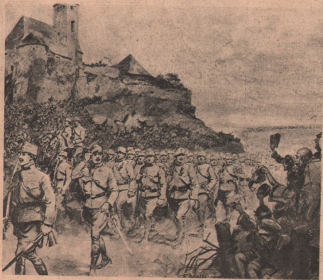
Vedere de pe câmpul de luptă din Polonia rusească: După ce trupele rusești s'au retras, trupele noastre austro-ungare intră în orașul Walbron, fiind primite de populația polonă cu aclamații, — căci Polonii, și nădăjduesc liberarea după ce trupele noastre vor rămâne definitiv învingătoare asupra celor rusești.