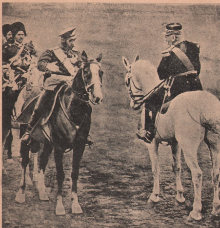
Comandanții supremi ai celor două armate aliate, rusă și franceză: Țarul Nicolae la stânga și generalul francez Joffre, generalissimul armatei franceze de operațiuni.