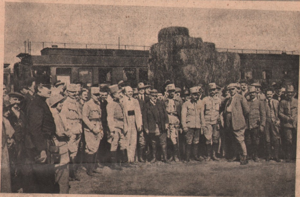
Ziariștii pe câmpul de războiu. — Vezi la „Rânduri mărunte” —