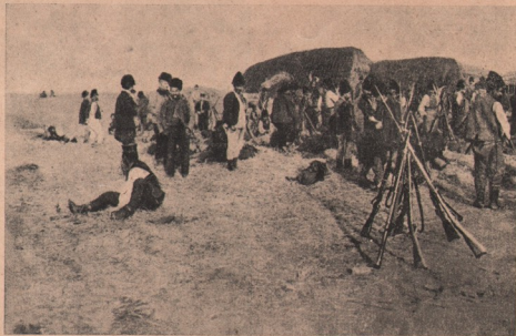
Vedere din armata sârbească: Sârbia și-a chemat sub arme și gloatele clasa a 2-a. Chipul de aci ne arată o trupă de astfel de gloate. Sunt oamenii în hainele lor de-acasă, doar de-au căpătat pușcă și gloante.