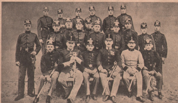
Tinerii cadeți, chemați la proba tăriei lor sufletești: Sunt tineri absolvenți ai școlii de cadeți din Timișoara, cari la 1 August au fost înaintați locțiitori de ofițeri și — trimiși la trupe și cu trupele, pe câmpul de războiu. Sunt tot băieți tineri de 19—20 ani. Nainte de a se risipi printre trupe, s'au fotografiat cu ofițerii lor instructori între ei.

E prea scump divorțul. Din Newyork se vestește: luriștii americani au avut un mare sfat în care s'au desbătut unele legi americane, cari vor fi schimbate încurând. Mai multă bătae de cap le-a dat învățăților legea de căsătorii și legea de divorț. După lungi discuții în privința aceasta, a răzbit părerea acestora, cari au propus că: în Statele Unite din întreagă America-de-Nord să fie una și aceeași lege de căsătorii, pentrucă numai așa s'ar putea înlătură multele proese de divorț, cari toate dovedesc, că în America se leagă căsătoriile prea ușuratic. S'a arătat ce păgubitoare sunt pentru vicia socială divorțurile și s'a dovedit, că nicăiri nu mai sunt atâtea femei despărțite și copii pribegi părăsiți de părinți, ca în Statele Unite ale Americiei-de-Nord. Tot mai mult s'a întărit convingerea Americanilor, că nu divorțul trebuie făcut anevoios, ori chiar imposibil, prin lege, — ci legea căsătoriei trebuie puțin îngreunată.