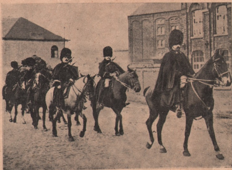
Calaverie belgiană de graniță, care ea a avut parte de cel dintâi foc în acest războiu germano-francez, întimpinând ea ca dintâi oștile germane ce le intrau în țară.