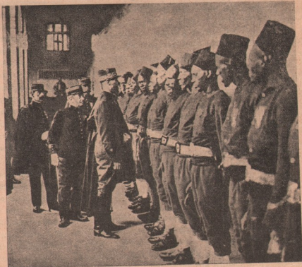
Armata franceză: Pregătirea trupelor africane, pentru a fi aduse se ice și ele parte la războiul „tării-mame“, în Europa. Ofițeri francezi le trec în revistă și le arată scopul înarmării. Ziarele spun, că deja astfel de trupe au fost debarcate în Franția și vor fi trimise pe câmpul de luptă.