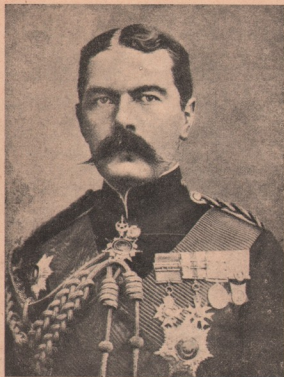
Armata engleză: Lordul Kitchener, fostul vicerege al Indiilor, — numit acum, din privilegiul războiului ministru de războiu al Angliei. El e care a dus la încheiere războiul contra Burilor, care până a nu primi el comanda supremă pe acel câmp de luptă, mergea prost pentru Englezi.

duce încă multe și interesante chipuri. Cei ce ar dori a le avea, să aboneze „Cosinzeana”. Prețul pe 3 luni 3 cor., pe 2 luni 2 cor., pe 6 luni 6 coroane.