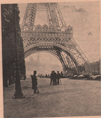
Turnul Eiffel din Paris, pus în slujba războiului: în acest turn uriaș e instalată azi o stațiune de radiotelegrafie, pentru trimiterea de aze din capitală pe câmpul de război și primirea de știri și cereri de pe acel câmp, — provăzută cu stațiuni telegrafice fără sarmă.

Interesant a vorbit despre căsătorie și divorț: Dr. Ana Howard Show, prezidenta ligei femeilor americane.