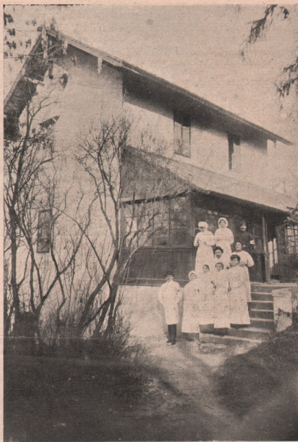
„Ambulanța Petran” — spital românesc în Cluj: — Medicul-șef și surorile de caritate și celalalt personal ajutor, în fața spitalului.

În fiecare an, ziua nașterii Mântuitorului, e pentru noi, cei dela această revistă, îndoită sărbătoare: Cu acest prilej noi sărbăm odată, cu toți creștinii, pe Cel ce s-a născut, ca să ne mântuiască de păcatul strămoșesc și sărbăm apoi, a doua oară, nașterea revistei acesteia, care e această sărbătoare inepetă, totdeauna un nou an de viață, un nou an de muncă, de jertfe și de mișcare culturală românească! De data aceasta