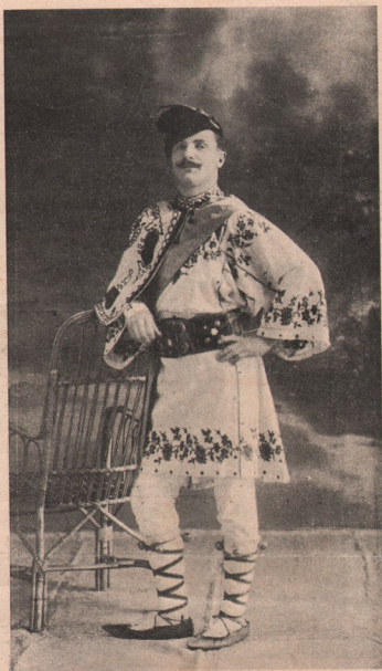
† Prof. Horațiu Deac dela preparandia din Gherla (dat pe pag. 1 în uniformă de soldat), — în costum național, ca conducător însuflețit al unui grup de căușeri inteligenți. Român bun, purtă cu fală acest costum la prilegiuri sărbătorești. — A purtat moartea de erou, ca voluntar plutonier în reg. 63 de infanterie, în crâncena luptă cu Rușii, întâmplată la 21 Octomb. 1914, lângă munții Jancoș (Galiția), în direcția Stary-Samborului. Eră în vârstă de abia 25 de ani... Despre profesorul iubit și de care se legau cele mai frumoase speranțe, — ni se scriu următoarele, de cătră un bun cunoscător al său din Gherla :