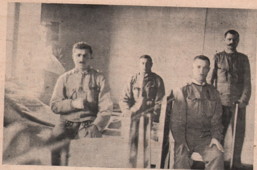
„Ambulanța Petran“ — Cluj: Un grup de răniți și bolnavi.

Străbătuți și azi, ca și acu-s 4 ani, de aceleași gânduri și de-aceleași idei, — începem noul an de viață. Alături de gândurile noastre senine și frumoase, stau cetitorii noștri aleși, al căror sprijin îl reclamăm îndoit de mult de dată aceasta. Nu numai vremile sunt mult mai grele și nu numai împrejurările excepționale de vîtreg pentru desășurarea steagului nostru, ca să ne îndemne la aceasta, ci și cadrele de dezvoltare, ce ni le vom impune în anul, pe care-l începem. Odată cu potolirea furtunei, noi simțim, că noui cărări vom începe, și o nouă dezvoltare, mai frumoasă, mai plină de nfeles și mai plină de roade. De-aceea, rugăm pe toți cetitorii noștri, ca de data aceasta să ne stea îndoit de mult în ajutor. Nu numai dănații să-și renoască abonamentele, pe anul, care vine, ci să ne câștige totodată și alți abonați noi, dintre prietînii, cunoșcutii și neamurile lor!