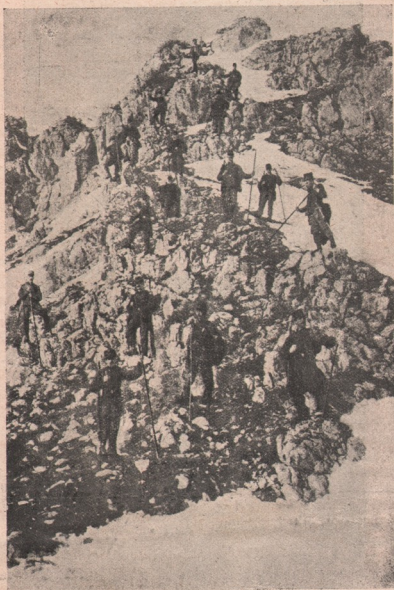
Opăcirea Rușilor în Carpați: Patrul de-ale armatelor noastre, sus pe stânci, pândind depărtările, ca la ivirea inamicului, să se adune și să le ație calea.

voinicii noștri frați și fii, cum se sting în neagra străinătate, lipsiți de fericirea de-a avea la căpătaii o mângâiere dulce de mamă ori o vorbă scumpă de soție, care să le alineze chinurile prin cari trece un muritor la nemurire! Câte suflete rămân cernite pentru întreaga lor viață, și câte inimi nemângăiate în veci pe urma color dispăruți!