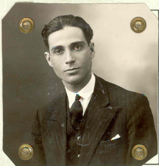
Semnătura titularului (Signature du porteur):