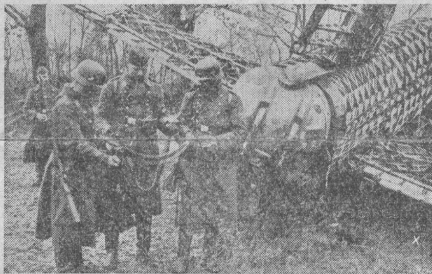
Avion sovietic doborât în liniile germane.