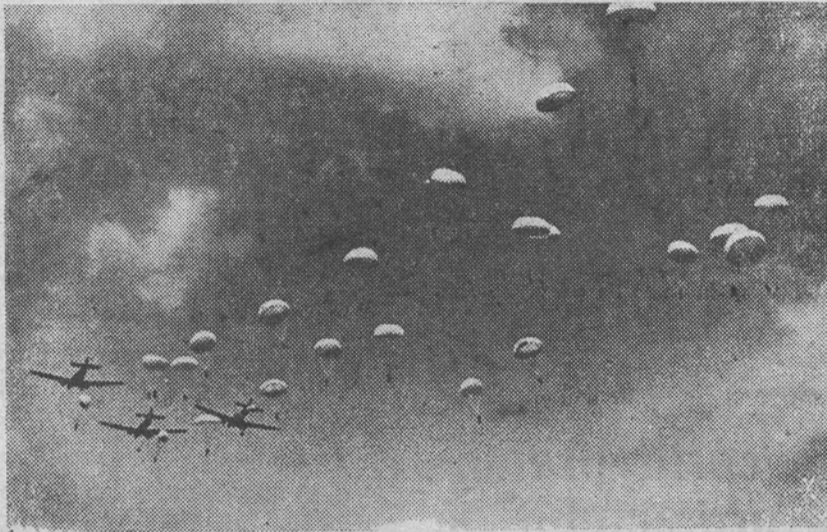
Un grup de „vânători parașutiști” în momentul lansării din avion.

Parașutele de astăzi sunt atât de perfecționate, încât sunt excluse accidentele datorită nefuncționării materialului, în schimb șocul destul de violent din momentul atingerii pământului poate provoca mici accidente, începând dela o simplă vânătee, până la fracturarea unui membru. Este cazul recentei