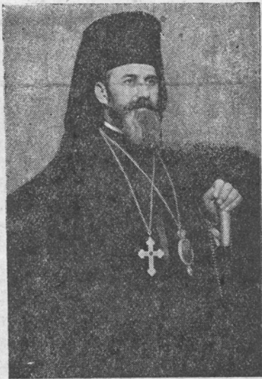
P. S. Sa Episcopul N. COLAN

După sfânta slujbă din Catedrală, deputații eparhiali au trecut în sala festivă din palatul reședinței episcopale, unde a avut loc deschiderea adunării prin cuvântul luminat, al P. S. Episcop Nicolae Colan, de față fiind și un însemnat număr de credincioși mireni.