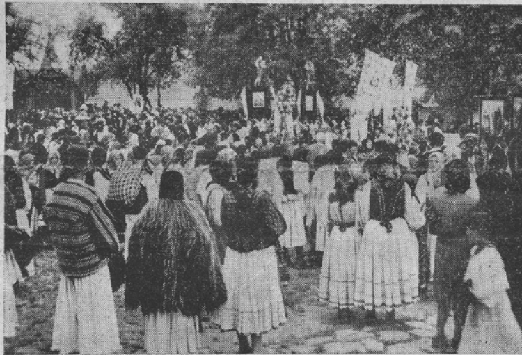
In timpul liturgiei

Potrivit datinelor și legilor străbune în fiecare an la Sânpetru mai ales (în proporții mai mici și la cele două Sântămării) se fac mari praznice în acest locaș de închinăciune, la care vin mii și mii de pelerini, nu numai Oșenii din apropiere, ci și Maramureșenii, Băimărenii, Sătmărenii, Ugocenii, etc. Și în anul acesta, în Dumineca trecută (29 Iunie), la sărbătoarea sfinților Apostoli Petru și Pavel, cu toată vitregia vremurilor s'a făcut obișnuitul praznic și pelerinaj. Cu toate că în acele zile s'a început, în apropiere, crâncenul război în contra colosului rusesc, cu toate că paserile morții brăzdau văzduhul, cu toate că maramureșenii auzeau bubuitul tunurilor de pe front, totuși mulți credincioși au venit să se închine și să primească cuvânt de întărire și îmbărbătare. Cât de înălțătoare și de emoționante sunt aceste praznice și pelerinaje își poate da seama numai cine le trăiește, cine vede și asistă la ceremoniile ce se fac în ajunul și în ziua praznicului, cine vede cum vis pelerinii și cum se roagă, în cântece și prea-