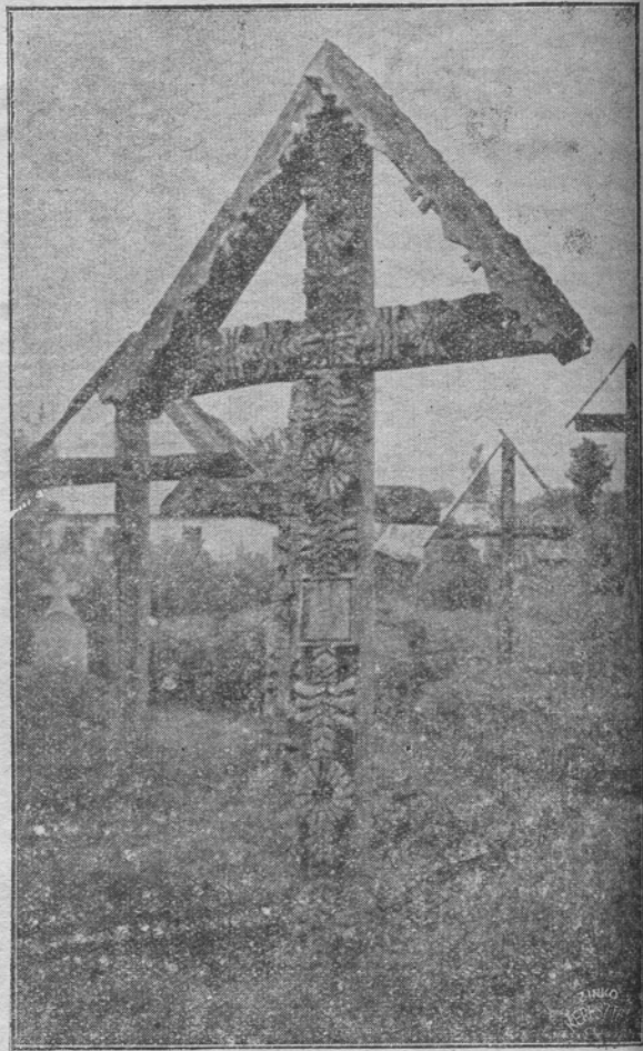
Poartă și cruce din Maramaros