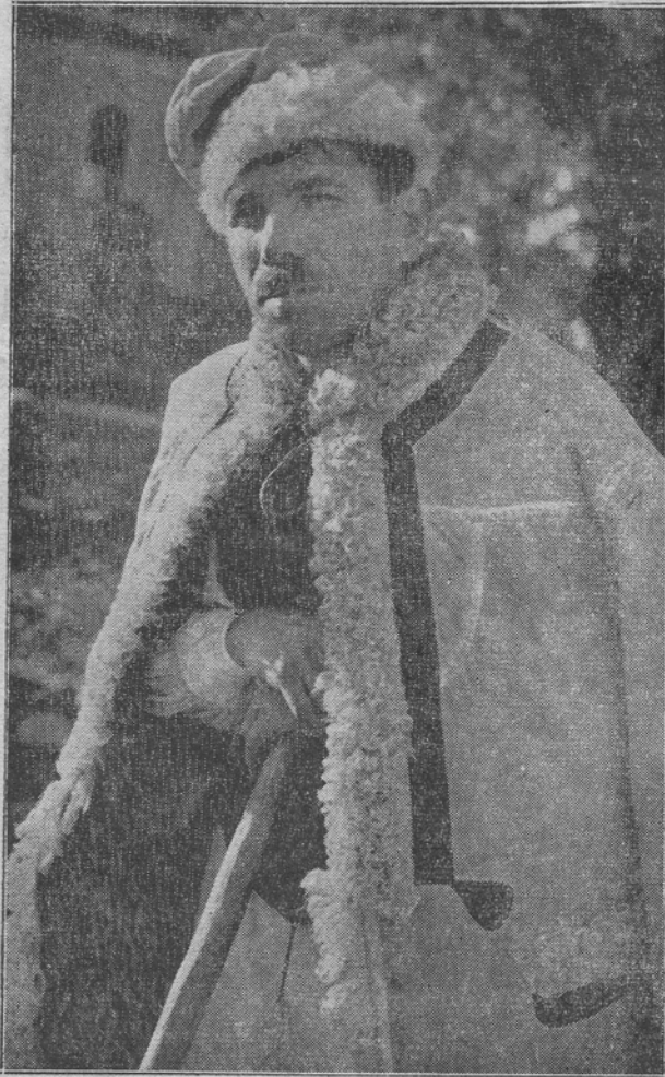
Pe ploaie, pe viscol, în vremuri bune și în vreme rea, ciobanul român cutreeră câmpiile în urma turmei și își cântă așa necazul:

Suflă vântul Uscă râțul, Rânduit mi-o fost urâtul. Suflă vântul, Uscă lazul.