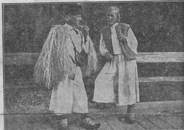
Țărani Români din Maramaros la sfat

Aducem la cunoștința celor care înscriserile la acest liceu vor fi în zilele de 25, 26 și 27 August în zilele de 8—12 a. m. Examenele de corectură și particulare se vor ține în zilele de 26, 27 și 28 August între orele 8—12 a. m. Deschiderea solemnă a anului 1941/42 va fi în ziua de 15 Septembrie la ora 10 a. m. Cursurile încep în ziua de 15 Septembrie la ora 8 dimineața.