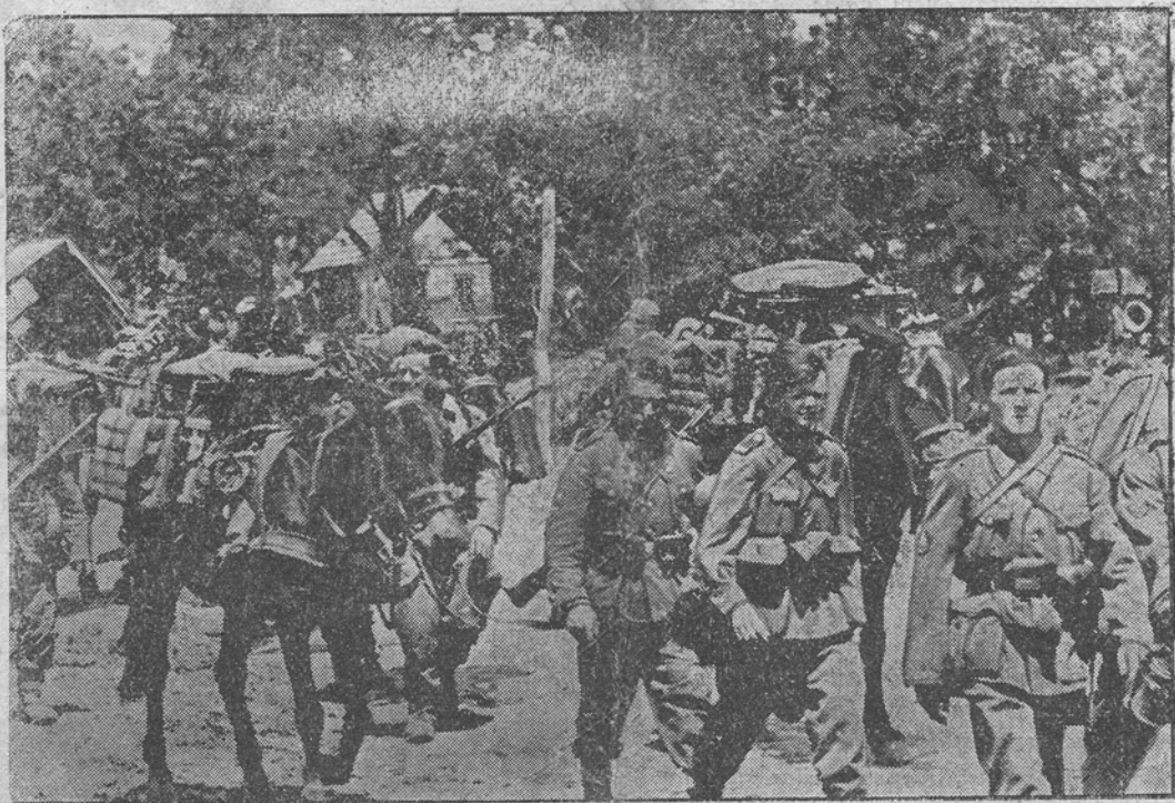
După lupte grele pe care le-au dat în Carpați, forțele aliate au străbatut în șesul Ucrainei, unde continuă înaintarea. Trupele de munte germane au jucat un rol hotărâtor în obținerea acestor succese.