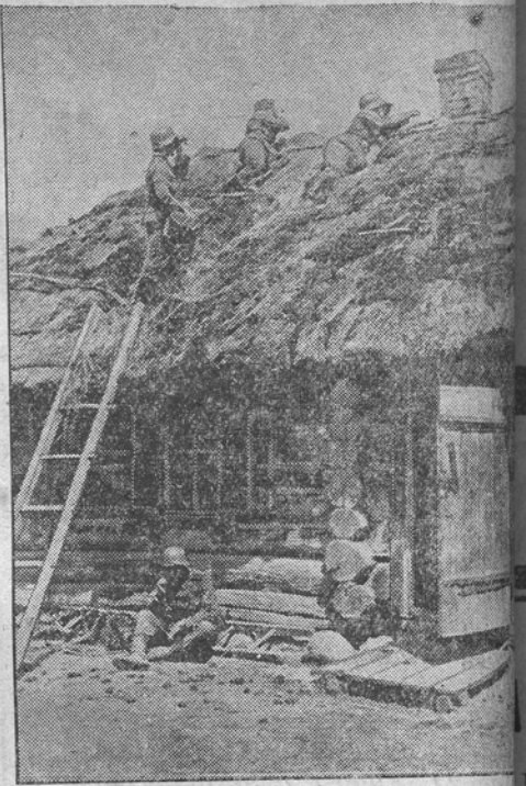
UN OBSERVATOR AL ARTILERIEI GERMANE