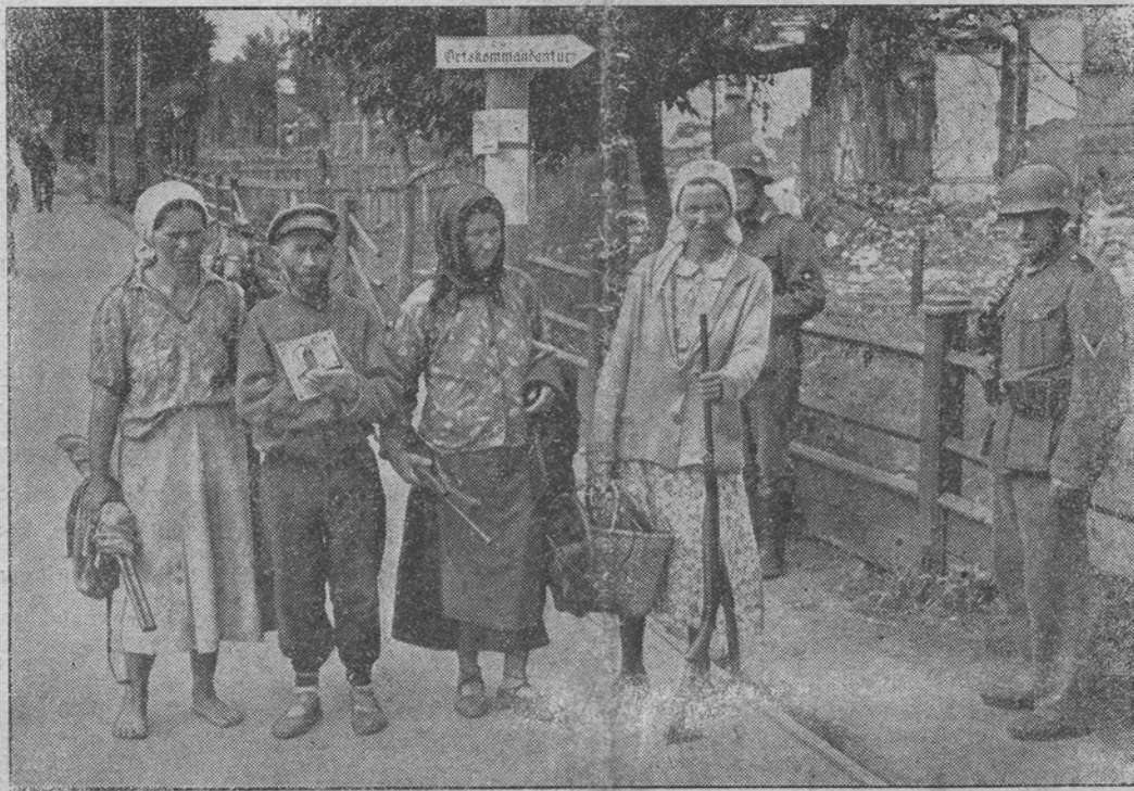
DEZARMAREA POPULAȚIEI CIVILE ÎN TERITORIILE OCUPATE