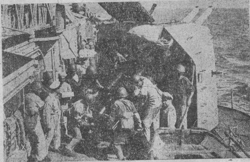
O baterie antiaeriană de pe bordul unui vas de război italian gata de a înfrunța atacul a vioanelor inamice.