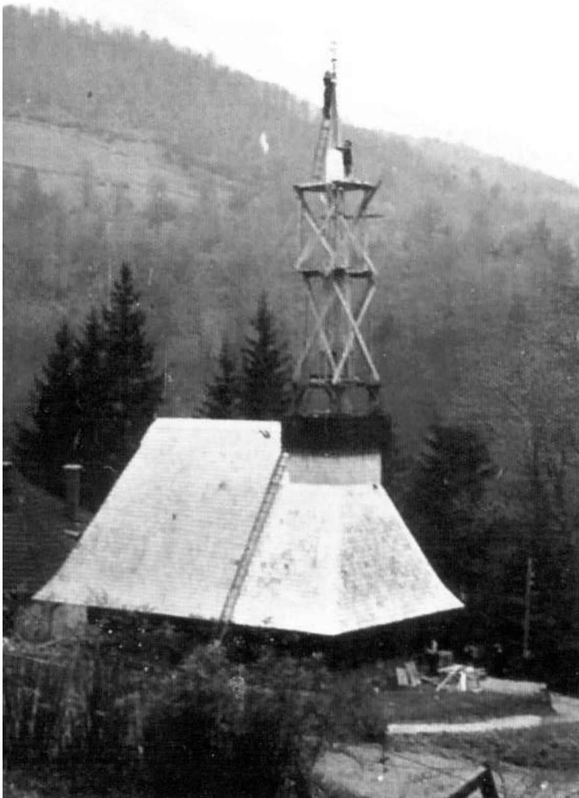
Biserica de lemn de la Ciucea în anul 1939

la Nicula), din care 11 sunt cuprinse în teritoriul administrativ al județului Cluj (6 mănăstiri de călugări și 5 mănăstiri de maici). 4