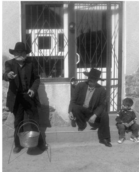
Gabori cu ceaun de vânzare

Dintr-o adresă a Poliției Huedin din 15 mai 1935 aflăm că, în primăvara anului 1935, s-a procedat la repartizarea rromilor în comunele Almaș, Fildu de Jos, Sfăraș, Jebuc și Izvoru Crișului. Se pare că și această nouă repartizare nu s-a pus în practică în totalitate, majoritatea rromilor rămânând pe teritoriul Huedinului într-un cartier pe care ulterior autoritățile comuniste l-au denumit „Cetatea Veche II”. La această concluzie ajungem și dacă analizăm componența etnică a comunelor cărora li s-a cerut primirea lor. La început locuind în colibe și bordeie, și-au construit apoi case din