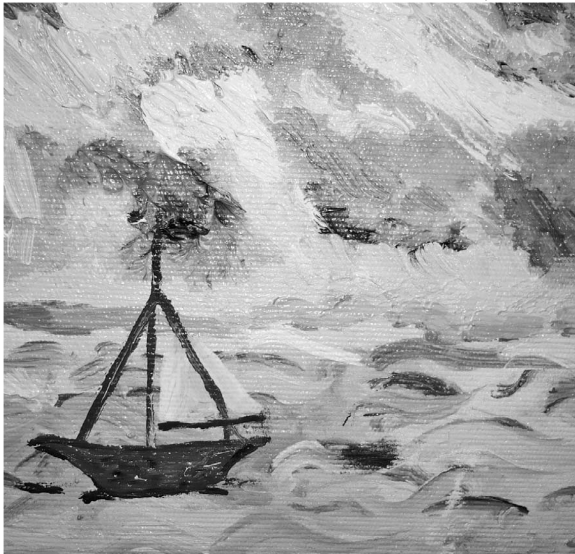
Mare, Mihaela Costea, cls. a II-a, Grup Școlar Huedin

(preluat din revista Viața de pretutindeni , nr. 11-12 / 2008)