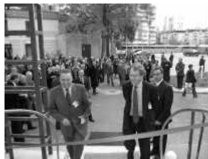
Universitari europeni în campusul studentesc clujean

Laitmotivul discuțiilor despre implicarea în structuri mai mari și mai complexe a fost prezent și la această dezbateră: păstrarea specificului. Asta pentru că fiecare universitate are un anumit mod de a se raporta la studiile doctorale și pentru că fiecareia îi este mai comod să practice metodele tradiționale decât să înceapă aplicarea unor noi structuri, experimentate doar de un număr redus de instituții de învățământ superior. Concluzia a fost una clară: nici o universitate nu poate fi obligată să participe la asemenea programe, pentru că soluția doctoratelor-europene în cotutelă