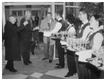
Un toast pentru succesul Conferinței

Alegerea orașului nostru ca gazdă a conferinței este rezultatul unei competiții serioase cu alte universități din întreaga Europă, în principal cu cele din Europa de Est. "Competiția" a vizat onoarea de a fi prima universitate din Europa