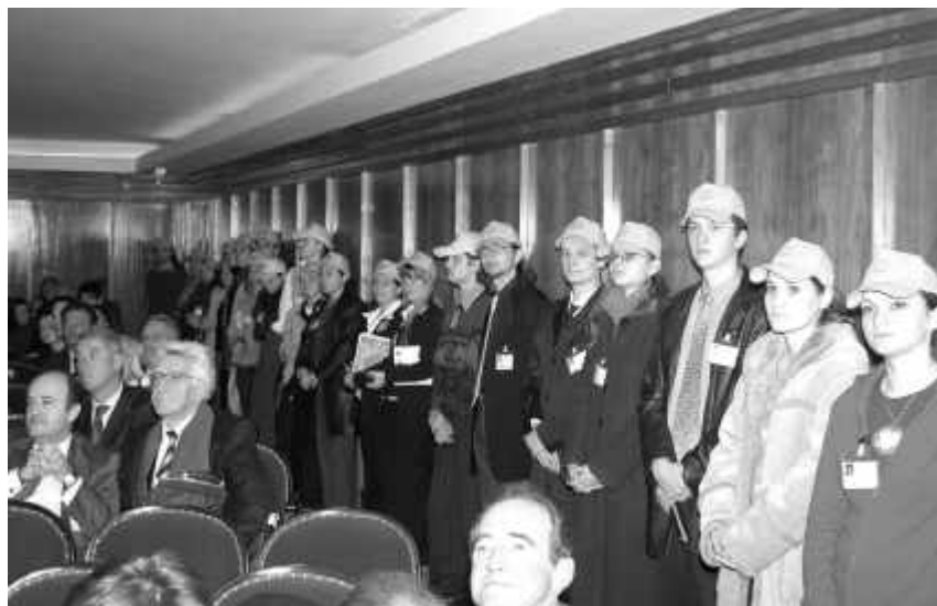
Studenții Universității au avut grijă ca ospitalitatea clujeană să fie pe deplin confirmată

Suntem studenți animați de dorința de a face ceva, de a arăta că putem face ceva, că putem construi. A fost plăcut să ne simțim utili și apreciați (material, am fost recompensați cu o bursă de merit, iar șepcutele galbene și umbrele au rămas la noi). Tot ce s-a întâmplat pe parcursul Conferinței a fost constructiv. Suntem capabili de a înfăptui lucruri frumoase dacă ni se acordă șansa și încrederea cuvenită. Studenții UBB demonstrează că se poate.