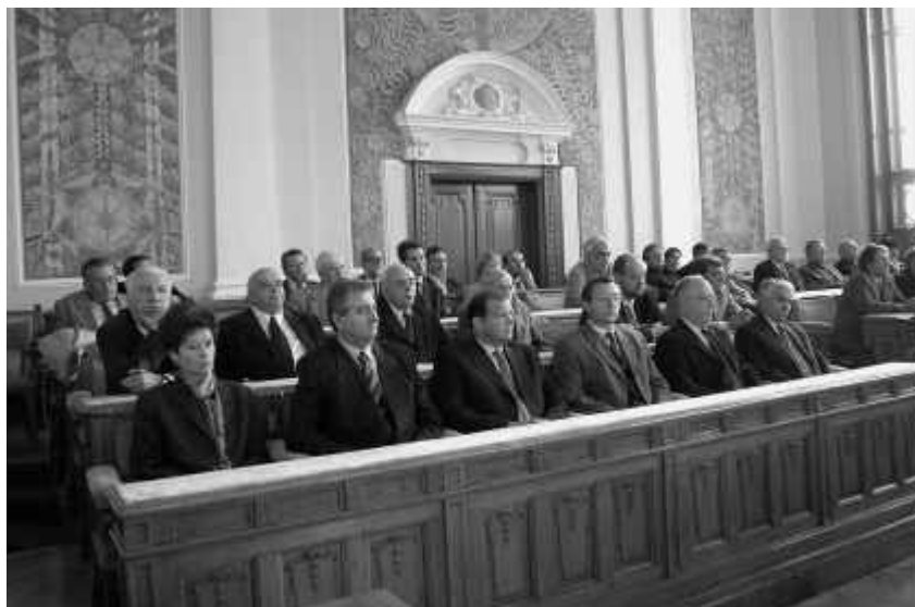
Participanți la Conferință în Aula Magna

Astăzi Universitatea Babeș-Bolyai înregistrează cea mai mare dezvoltare a universității la Cluj. Cu peste 44.000 de studenți, cu 20 de facultăți și 18 colegii în teritoriu, cu organizarea trilinguală a studiilor, cu specializări consacrate în hard sciences , în humanities , în economie și business, în inginerie, în arte și în educație fizică, cu programe de învățare a douăzeci și două de limbi, cu patru facultăți de teologie, Universitatea Babeș-Bolyai asigură oportunități de studii din cele mai variate. Privim diversitatea lingvistică și culturală ca o bogăție și un avantaj, și nu ca o limitare a celui alt, și căutăm să o fructificăm. Ca rezultat, nicidecum în principală universitate din Transilvania nu au studiat mai mulți români. Nicidecum nu au studiat mai mulți maghiari. Nicidecum oportunitățile de studii în germană nu au fost atât de mari. Nicidecum istoria și