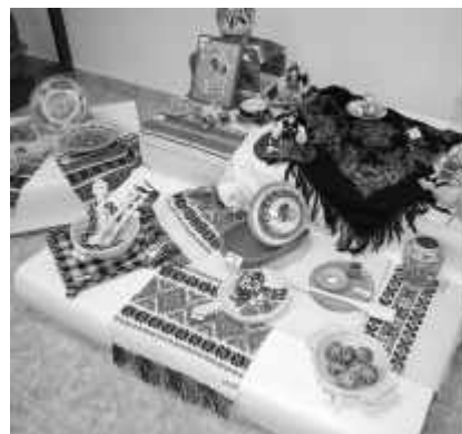
Distincții oaspeții au făcut cunoștință cu zestrea etnografică transilvană

Menționez că au fost alese șase hoteluri și fiecare grup de studenți se îngrijea de personalitățile cazate în hotelul de care era responsabil. Dimineața îi urcăm în autocare. Unul sau doi dintre noi rămâneam la hotel până la orele zece în caz că unii participanți întârziu. Apoi toate echipele în formula completă se adunau la Colegiul Academicum, locul unde s-a desfășurat Ședința