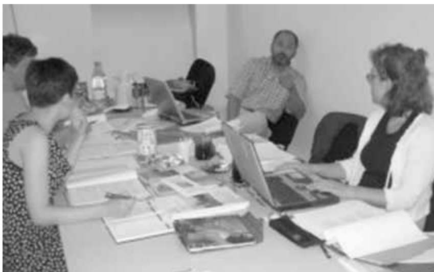
Imagine din sesiunile de lucru pregătitoare ale proiectului Predarea istoriei și educația pentru cetățenie democratică în România

EUROCLIO (Conferința Europeană Permanentă a Asociațiilor Profesorilor de Istorie) CENTRUL EDUCAȚIA 2000+ Proiectul este sprijinit în România de: • Ministerul Educației, Cercetării și Tineretului • Consiliul Național pentru Curriculum • Serviciul Național de Evaluare și Examinare • Agenția Națională pentru Formarea Personalului din Învățământul Preuniversitar • Inspectoratele școlare județene Proiectul este finanțat prin programul MATRA, derulat de Ministerul Afacerilor Externe al Regatului Țărilor de Jos, și de Fundația pentru o Societate Deschisă, prin CENTRUL EDUCAȚIA 2000+ din România.