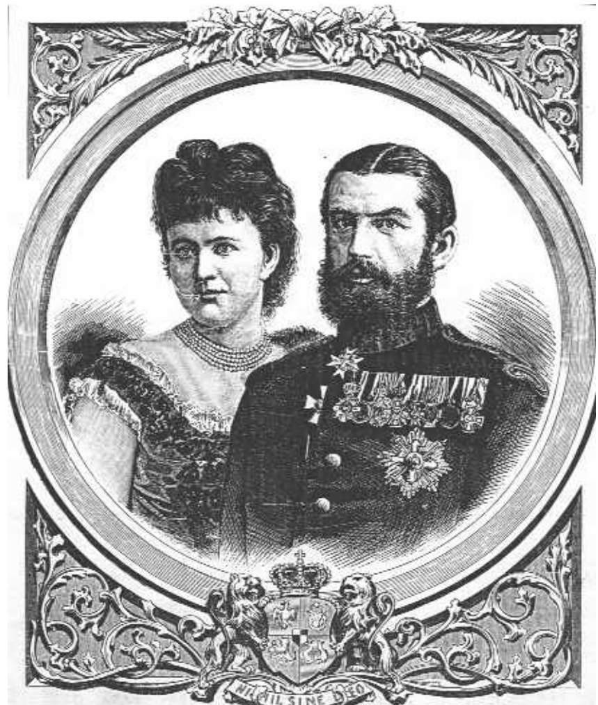
Regele Carol I și regina Elisabeta. Gravură pe coperta revistei "Illustrierte Zeitung" din Leipzig din 4 iunie 1881, reprodusă după o fotografie de Franz Duschek