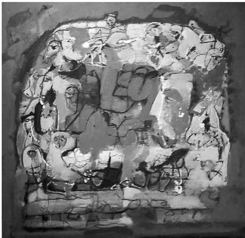
Dealul cu amintiri