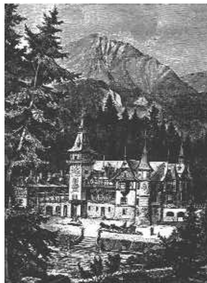
Castelul Peleş din Sinaia. Desen de L. Skell, reproduc de revista "Ueber Land und Meer", nr. 18/1884