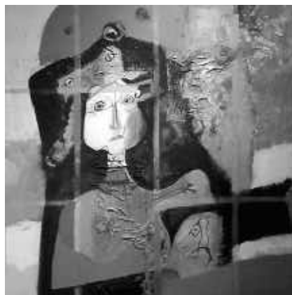
Fata în roz

– Deși lucrările dumneavoastră au o mare încărcătură emoțională, o viziune autentic-originală și o mare puritate stilistică, am avut impresia că nu doriți să dați prea multe repere și date despre ele. Titlurile sunt puse cu foarte multă modestie. Am observat existența multor forme și motive zoomorfe sau antropomorfe care conțin la rândul lor alte forme și motive de aceeași natură. Vorbesc de anumite portrete care conțin alte portrete sau siluete de personaje și animale care conțin alte animale sau personaje. La ce v-ați gândit? Ați încercat vreodată să le explicați prin cuvinte?