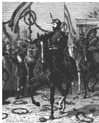
Carol I la 1878. Desen de Emil Volkers, reproducus de revista „Daheim”, nr. 21/1879

Ornea îl constituie o mărturie a lui Șerban Cioculescu. Nicolae Iorga i-a relatat acestuia din urmă, prin anii '30, cum regele Carol al II-lea s-ar fi referit la Tzigara-Samurcaș folosind vorbele „unchiul meu”. Nicolae Iorga, însă, nu e un martor credibil în ceea ce-l privește pe Tzigara-Samurcaș, pe care, din cauza funcțiilor