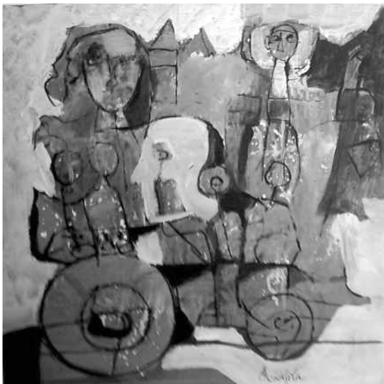
Amintiri citadine III

Cel mai interesant „sistem de oglinzi” este acela care implică „oglinzirea” Autorului în omniprezența Naratorului, precum și „oglinzirea” simbolică a acestuia (de fapt a amândurora) în tainele celor doi prieteni, Pașadia și Pantazi: "la plăcerea de a mă bucura de prietenia a două ființe atât de unice fiecare, s-adaugă aceea, pentru mine neprețuită, de a mă afla între două taine ce puse, ca două oglinzi, față în față, s-adânceau fără sfârșit. Mă-ntrebam numai dacă din ele avea să mi se dezvăluie vreodată ceva?". „Oglinzirea” Autorului în Naratiune, în oscilanta experiență de viață imaginată a Povestitorului provine din adoptarea perspectivei narative a lui „eu” pe care Roland Barthes o definește astfel: „Mai puțin ambiguu, eu este totodată mai puțin romanesc: el este deci deopotrivă soluția cea mai directă, atunci când povestirea rămâne dincoace de convenții, și cea mai elaborată, pentru situația în care eu se situează dincolo de conveție și încearcă să o distrugă orientând povestirea spre falsul natural al unei