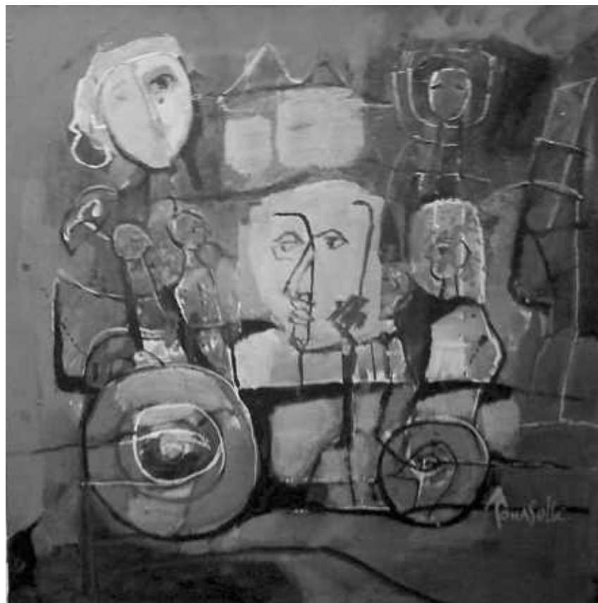
Amintiri Citadine II