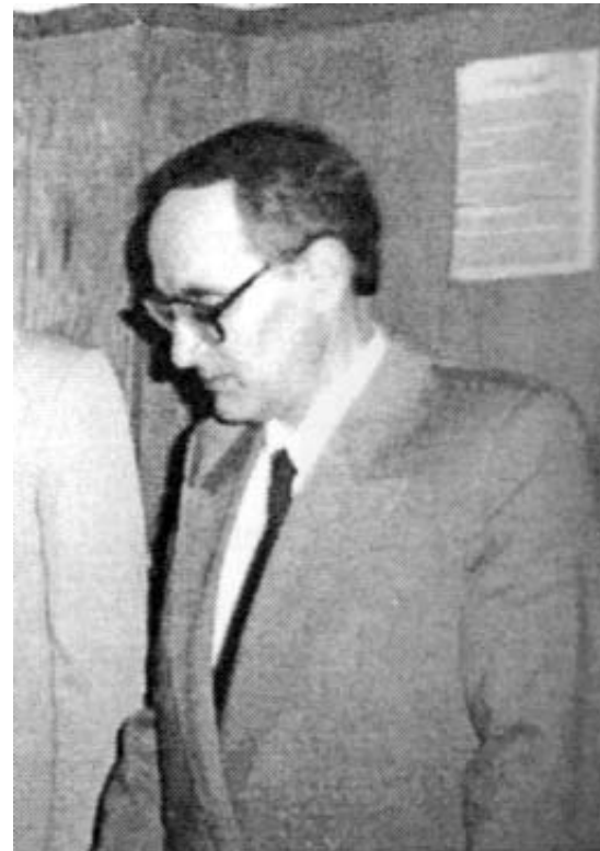
- Mă refer la viitorii dumneavoastră colaboratori.