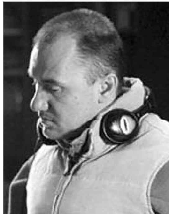
Regizorul Radu Muntean

Ce au cele trei filme în comun? Faptul că sînt forme de apropiere ale unui eveniment istoric real. Mai mult, fiind vorba de artă, pot spune că cele trei filme sînt refracția unei realități prin ființa unor creatori. Dacă din punct de vedere problematic filmele lui Mitulescu și Porumboiu sînt tipuri noi de re-prezentare a unui eveniment real, Hârtia va fi albastră vine să împlinescă și să încheie un demers început și continuat de un același (neobosit realizator de pelicule penibile în