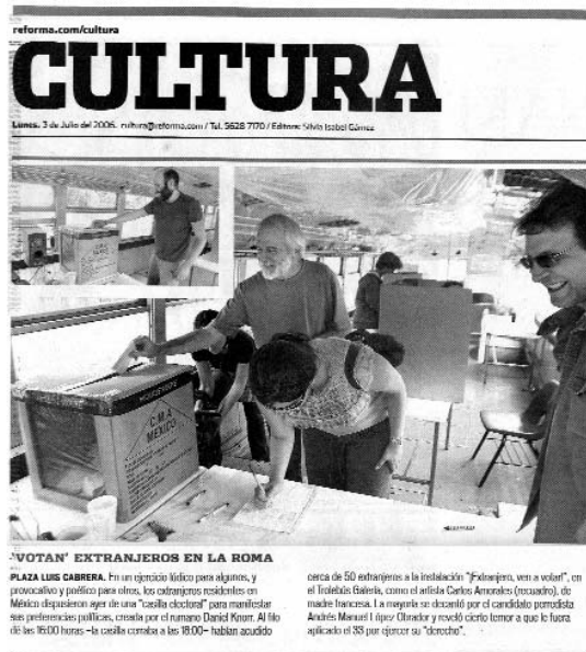
"VOTAN" EXTRANJEROS EN LA ROMA

Ne dorim împreună cu autorul ca demersul său solidar să nu rămână unul solitar în peisajul istoriografiei contemporane, ci, mai degrabă, un îndemn pentru întreprinderi similare al istoricilor din toate centrele universitare.