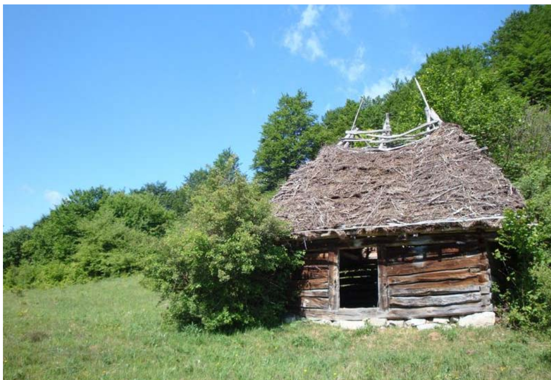
Grajd de vară

Apărură ceilalți colegi pe scările care duceau spiralat spre vestiar, iar eu, alertat că voi fi surprins privind prin gaura cheii la vestiarul fetelor am bătut la ușă, anunțându-mă în calitate de profesor de serviciu. O căutam tocmai pe colega divei. Surprinse de stilul agresiv în care îmi făcusem apariția, colega era timorată, iar diva se uita nepăsătoare, cu genele arcuite de nerăbdarea de a afla motivul pentru care o chemasem pe colega ei de clasă.