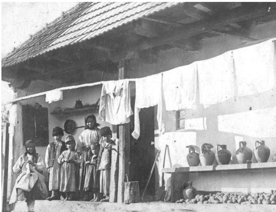
Familie de români din Negreni (1911)