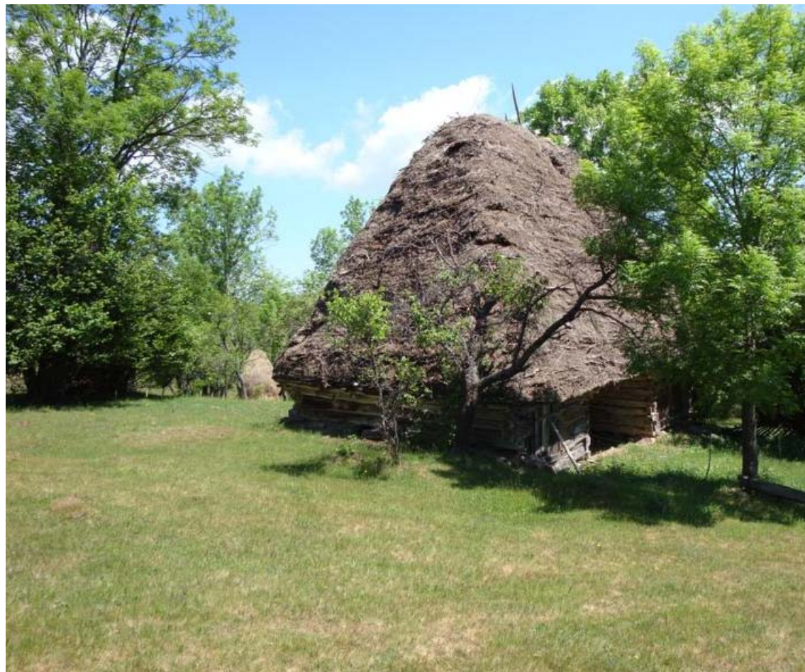
Șură cu paie la Ponor